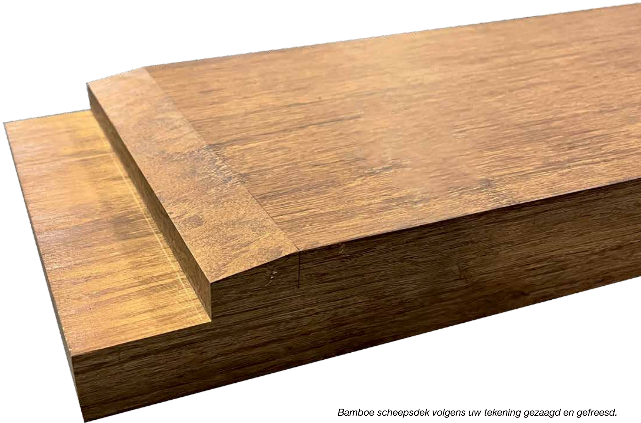
Bamboe scheepsdek volgens uw tekening gezaagd en gefreesd.